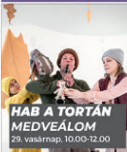
HAB A TORTÁN MEDVEÁLOM 29. vasárnap, 10.00-12.00