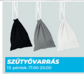
SZÜTYŐVARRÁS 13. péntek, 17.00-20.00