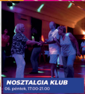
NOSZTALGIA KLUB 06. péntek, 17.00-21.00