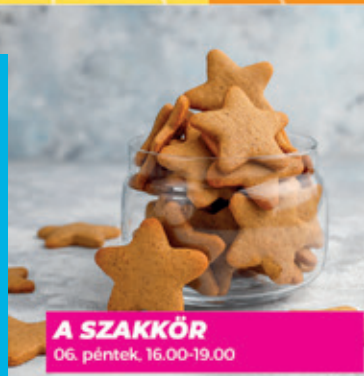
A SZAKKÖR 06. péntek, 16.00-19.00