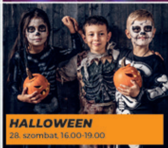
HALLOWEEN 28. szombat, 16.00-19.00