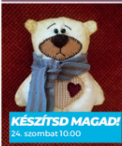
KÉSZÍTSD MAGAD! 24. szombat 10.00