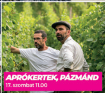
APRÓKERTEK, PÁZMÁND 17. szombat 11.00