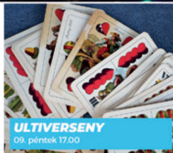
ULTIVERSENY 09. péntek 17.00