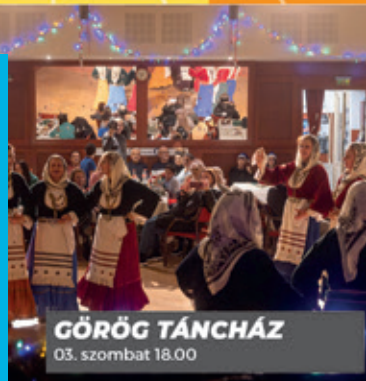
GÖRÖG TÁNC HÁZ 03. szombat 18.00