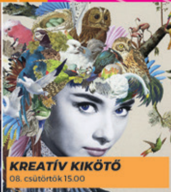
KREATÍV KIKÖTŐ 08. csütörtök 15.00