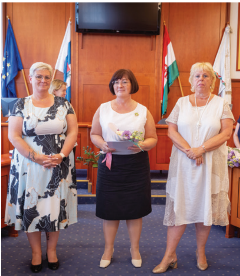
Fotó: Csákonai 15

A Semmelweis-nap minden évben július 1-jén van (1818-ban ezen a napon született Semmelweis Ignác, az „anyák megmentője”), ilyenkor a patikák és orvosi rendelők is zárva tartanak, az egészségügyi ellátás ügyeleti rendben zajlik.