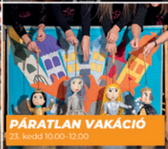
PÁRATLAN VAKÁCIÓ 23. kedd 10.00-12.00