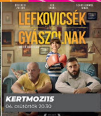
KERTMOZI 04. csütörtök 20.30