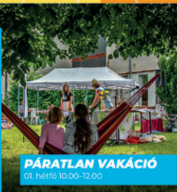
PÁRATLAN VAKÁCIÓ 01. hétfő 10.00-12.00