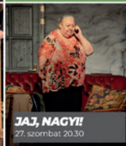
JAJ, NAGY! 27. szombat 20.30