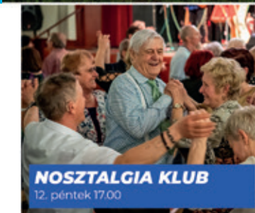
NOSZTALGIA KLUB 12. péntek 17.00