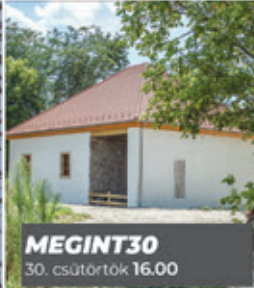
MEGINT30 30. csütörtök 16.00