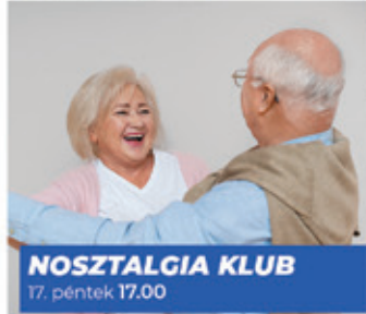
NOSZTALGIA KLUB 17. péntek 17.00