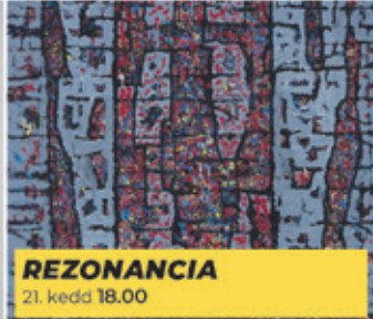
REZONANCIA 21. kedd 18.00