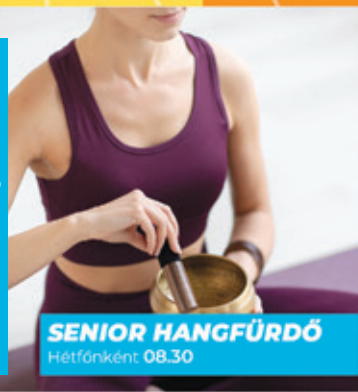
SENIOR HANGFÜRDŐ Hétfőnként 08.30