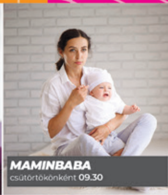
MAMINBABA csütörtökönként 09.30