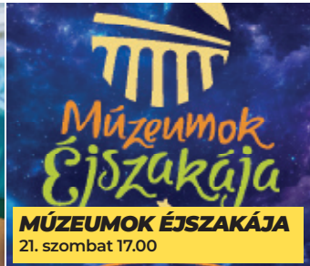
MÚZEUMOK ÉJSZAKÁJA 21. szombat 17.00