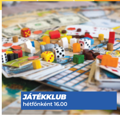
JÁTÉKKLUB hétfőként 16.00