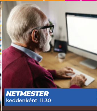
NETMESTER keddenként 11.30