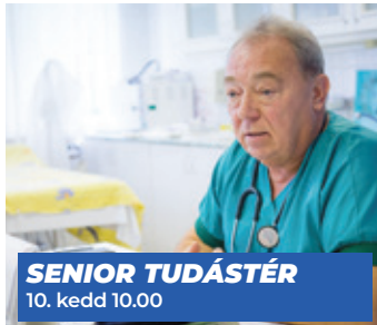
SENIOR TUDÁSTÉR 10. kedd 10.00