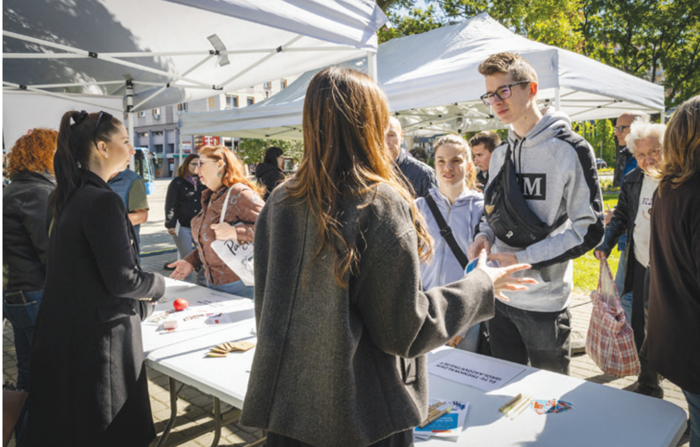
Fotó: Csokonai 15