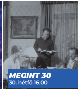
MEGINT 30 30. hétfő 16.00