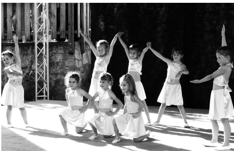
A Sunflowers modern tánc csoport fellépése a 2009. évi Szentiván-éji Vigasságokon