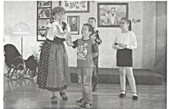
Mesemondó verseny 4. oldal