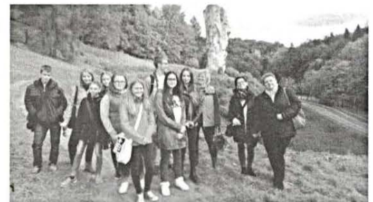
Tarcali diákok Lengyelországban 5. oldal