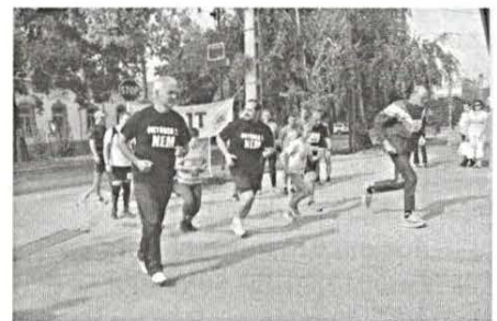
Aradi vértanúk emlékfutás 8. oldal