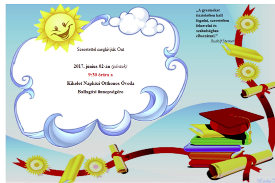
Óvodai hírek (4. oldal)