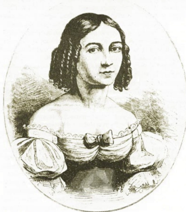
Déryné hiteles képmása