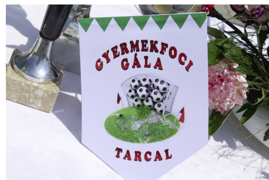
Gyermekfoci gála (8. oldal)