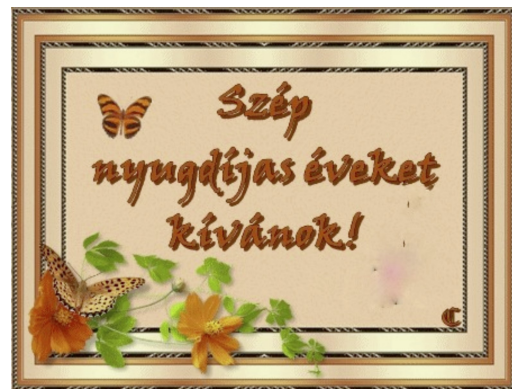
Nyugdíjba vonultak (3. oldal)