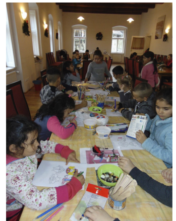
Karácsonyi játszóház (4. oldal)