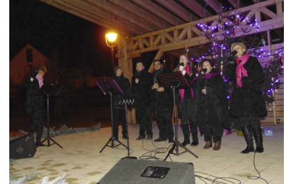
Adventi gyertyagyújtáson a kórus (4. oldal)