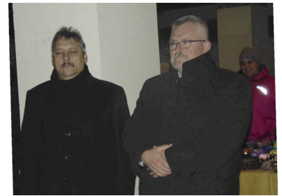
Vendégek az Adventi rendezvényen (4. oldal)