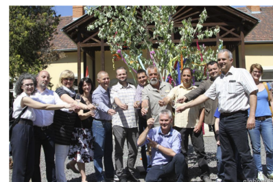
Búbajos hétfégi program (3. oldal)