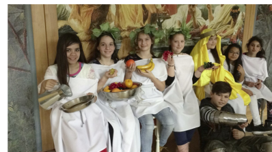
Tarcali iskolások a Seuso-kiállításon (2. oldal)