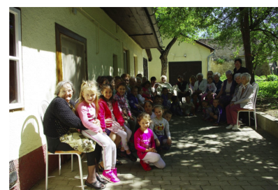
Anyák Napja az Idősek Klubjában (8. oldal)

„Egy férfi sokra képes, de egy anyát sohasem tud helyettesíteni!”