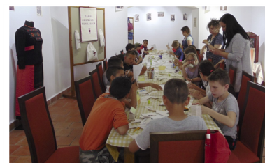
Barkó kézműves foglalkozás (4. oldal)