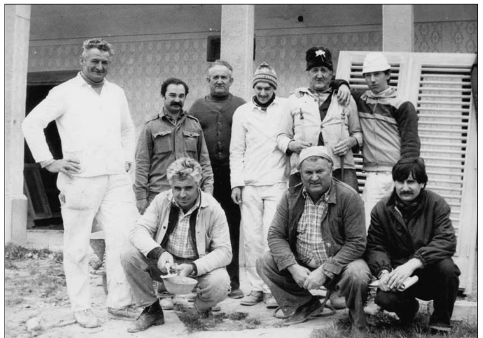
ANDRÉ KERTÉSZ EMLÉKHÁZ ÉPÍTÉSÉN A BRIGÁD