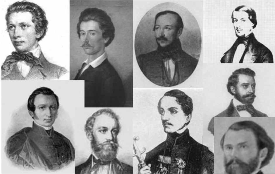
Vajda, Petőfi, Vörösmarty, Irinyi, Czuczor, Jókai, Vasvári, Degré, Hamary