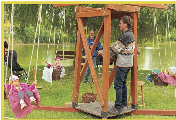
Szent Mihály napi sokadalom