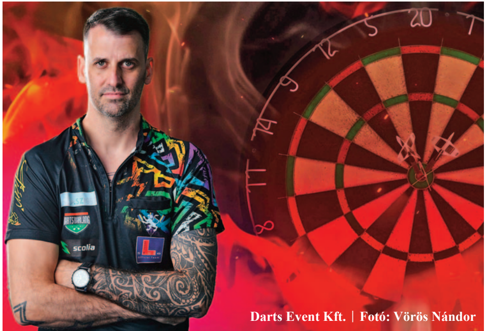
Darts Event Kft.

Az idén elért eredmények időrendben, ami dobogós vagy nemzetközi, s ezáltal