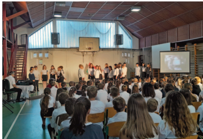
Október 23-i ünnepség