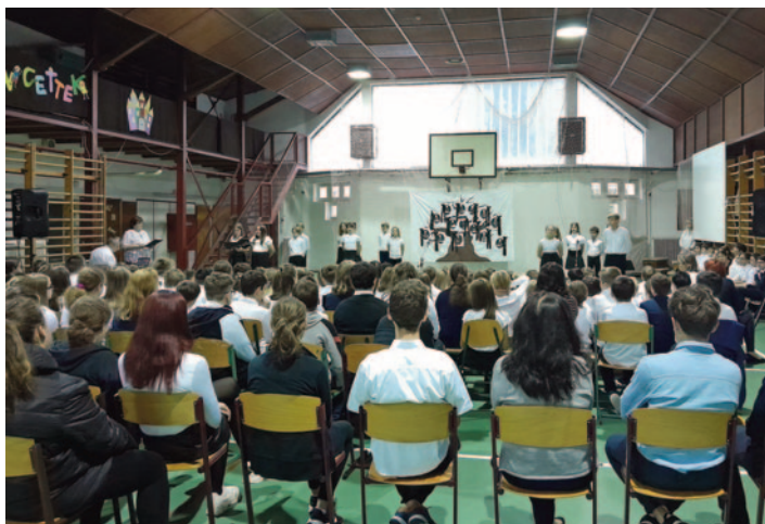
Október 6-i ünnepség