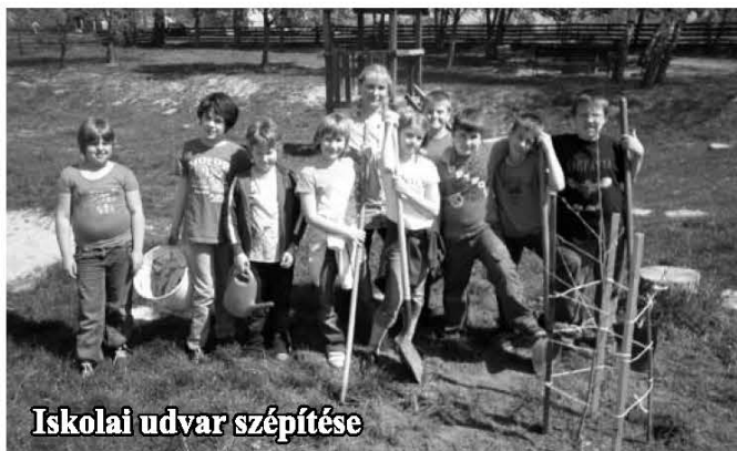
Iskolai udvar szépítése