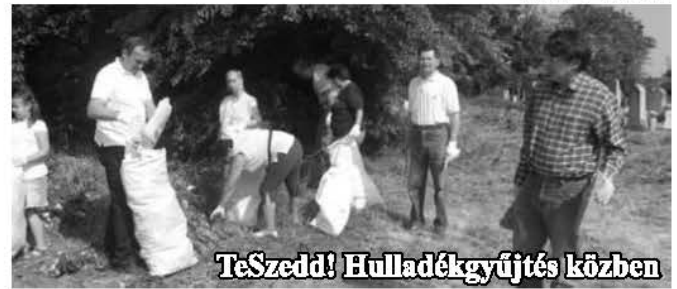
TeSzedd! Hulladékgyűjtés közben