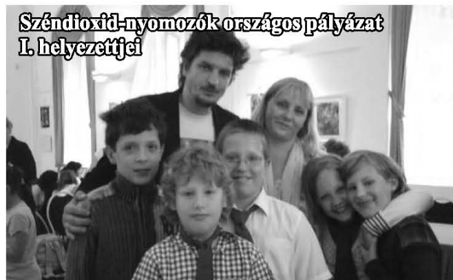
Széndioxid-nyomozók országos pályázat I. helyezettei