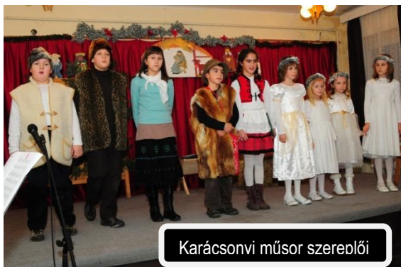
Karácsonvi műsor szereplői