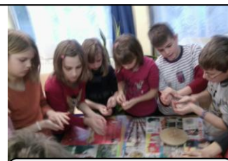
Madárkalács készítése Környezetvédelmi szakkörön