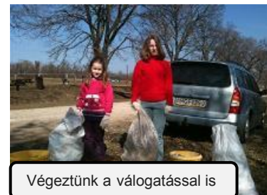
Végeztünk a válogatással is