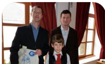
Az oklevél és ajándékcsomag átvétele után

2012. április 28-án várunk minden érdeklődőt a parkerdei esőbeállónál madárgyűrűzési bemutatóra!