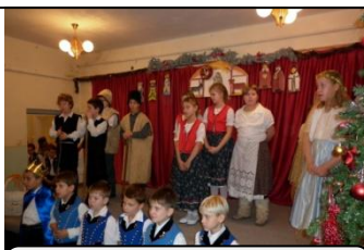
Emlékező karácsonyi műsorunk