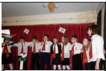
Március 15. emlékére műsor és ünnepély