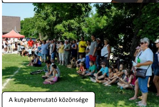
A kutyabemutató közönsége