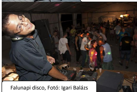
Falunapi disco, Fotó: Igari Balázs