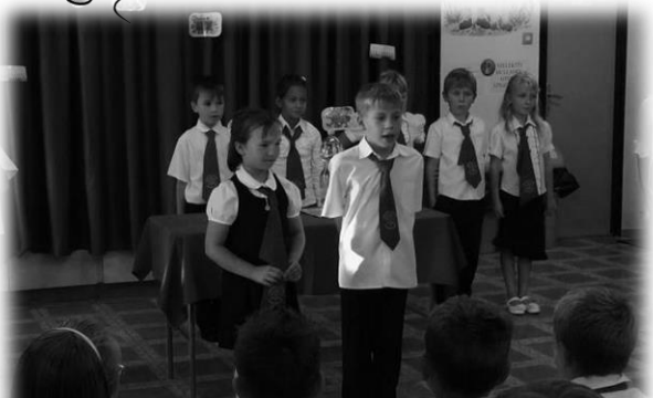
A második osztályosok vidám műsorával kezdődött a tanév.