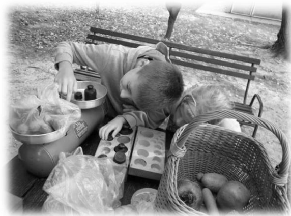
Két alkalommal a székesfehérvári Koronás Parkban tartottunk testedzést.