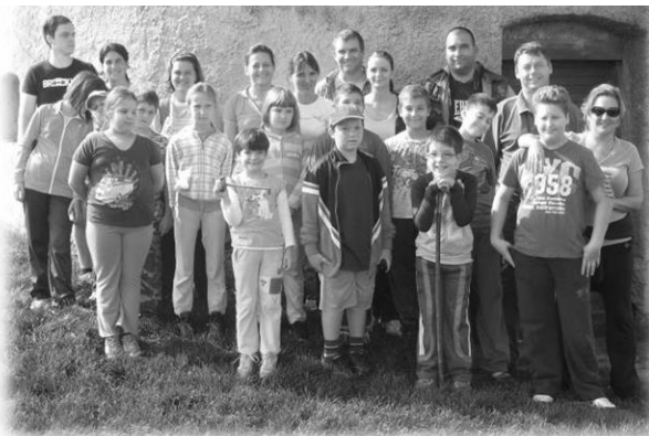
A harmadikosok Burok-völgyi és tési családi kiránduláson vettek részt