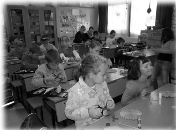
Az őszi játszótér sok élménnyel gazdagította tanítványainkat: volt méricskélés, versmondás, lajhármászás, kézműveskedés, feladatlap kitöltése, gyógynövények, fűszernövények ismertetése, névadónk, Bársony István novella részletének előadása stb.