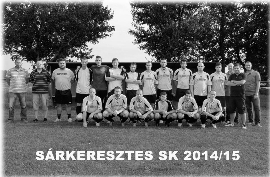
SÁRKERESZTES SK 2014/15