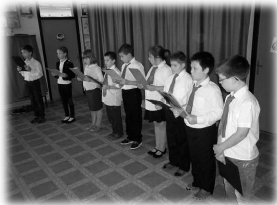
2014.október 6-án a 3. osztályosok műsorával emlékeztünk meg a pesti Újépület udvarán kivégzett gróf Batthyány Lajos, Magyarország első alkotmányos miniszterelnökéről, az Aradon kivégzett, a szabadságharc 12 honvéd tábornokáról és egy ezredeséről, az aradi vértanúkról.