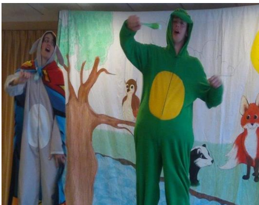
A Szegedi Látványszínház gyermeknapi előadása a Művelődési Házban