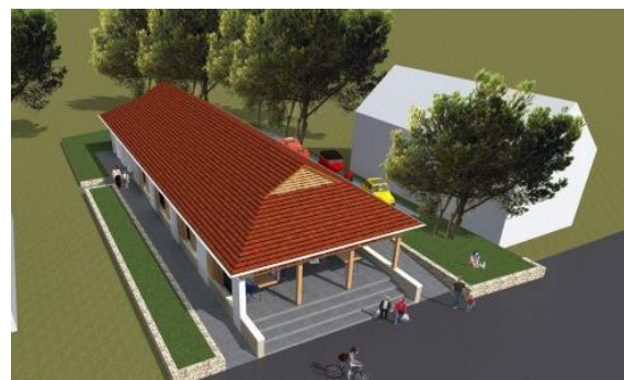
Helyi termelői piac látványterve