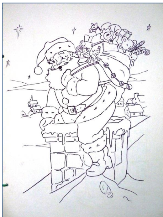
Rajzolta: Egri Ferenc