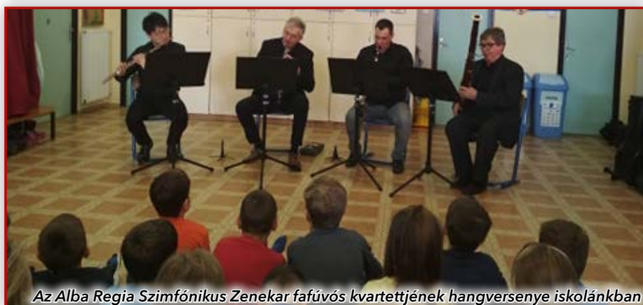
Az Alba Regia Szimfónikus Zenekar fafűvös kvartettjének hangversenye iskolánkban