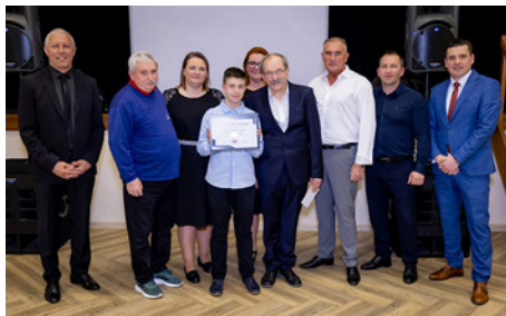
A 2024-es év egyesülete: Az Eleki Asztalitenisz Sportegyesület