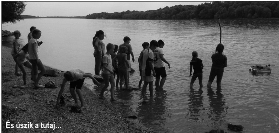
És úszik a tutaj...