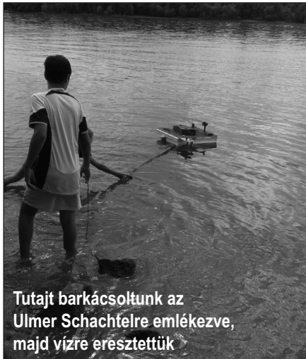
Tutajt barkácsoltunk az Ulmer Schachtelre emlékezve, majd vízre eresztettük