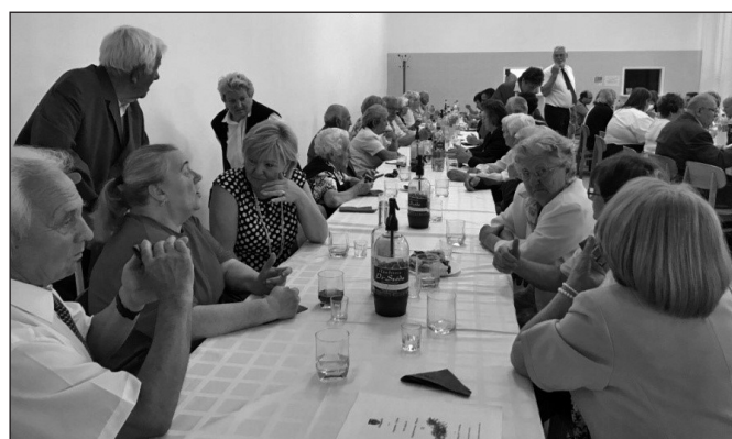
Délutáni kötetlen beszélgetés