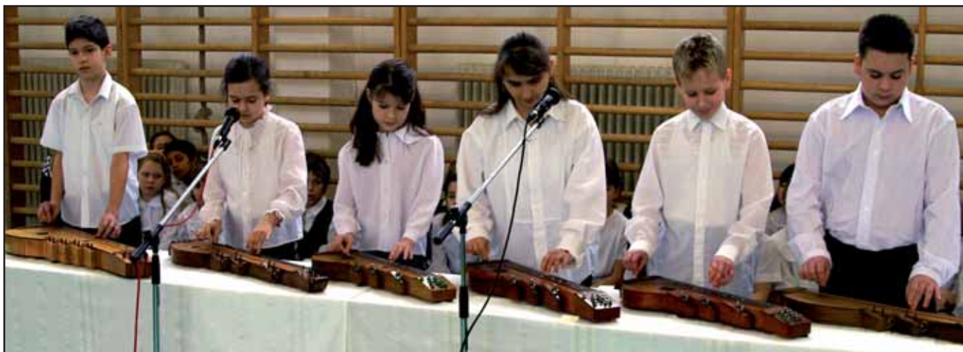
PILLANATKÉPEK AZ ISKOLAÁVATÓ ÜNNEPSÉGRŐL