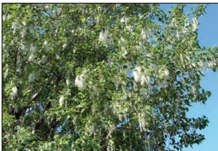
Az elmúlás a fákat sem kíméli (7. oldal)