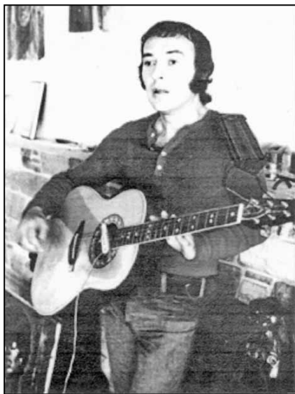
Az 1970-es évek elején