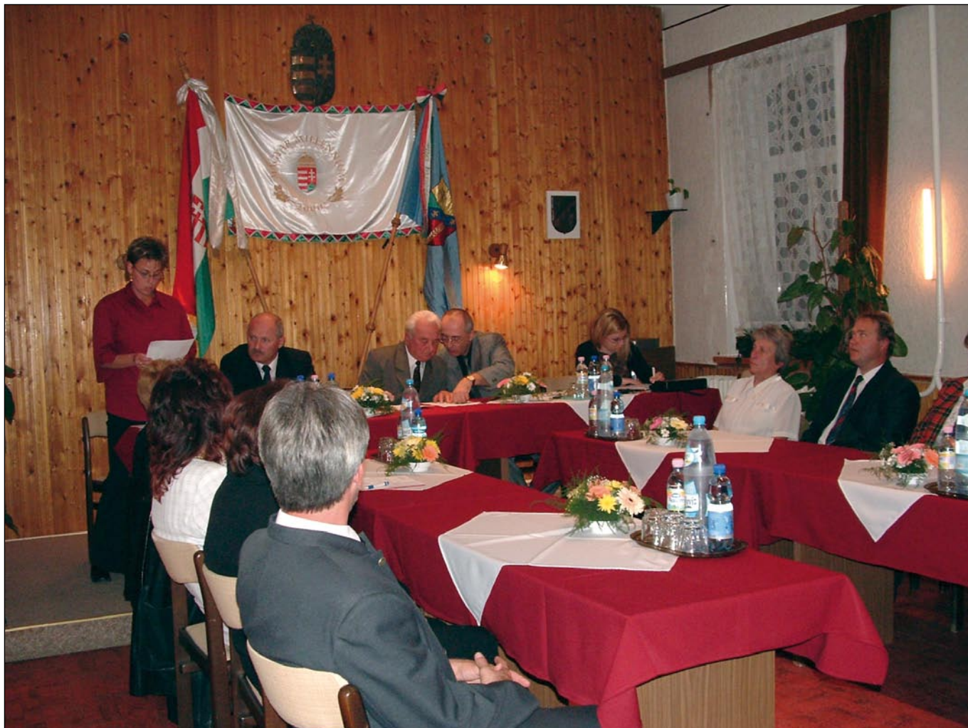
AZ ÚJ KÉPVISELŐ-TESTÜLET ALAKULÓ ÜLÉSE