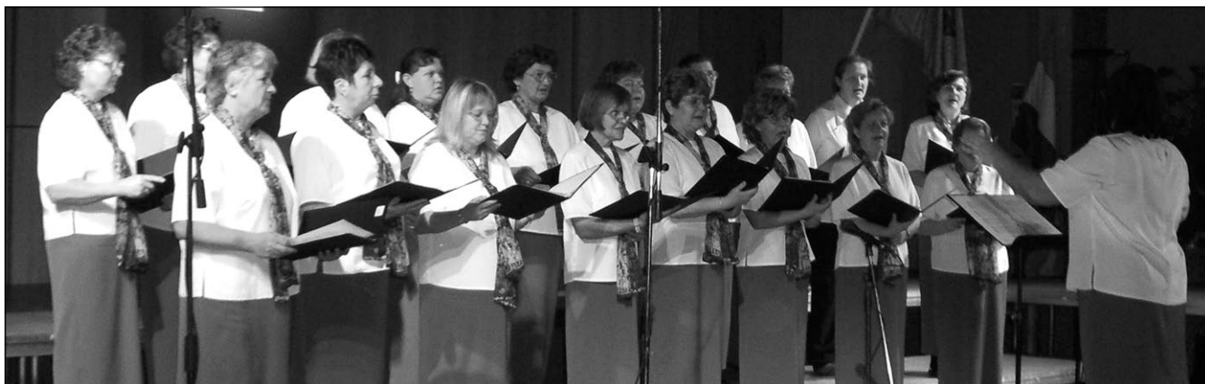
A meghívott vendégek között volt a herceghalmi Labdarózsa Kórus is

Ezt követően a két férfikórus meglepetésként nagy sikerrel adta elő Verdi két kórusművét, Búcsú a házától, és Rabszolgakar.