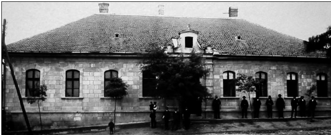
A sósokúti községháza 1906-ban épült 25000 korona költséggel.