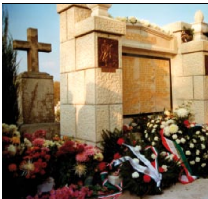
Megemlékeztek a II. világháború katonáldozatairól. Cikk: 24. oldal