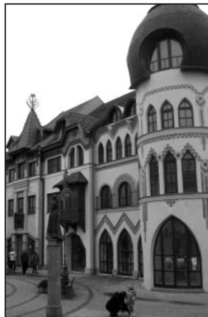
A magyar ház az Európa-udvarban

Ekecs, a Kisalföld északi részén, a Csallóközben, Nagymegyér város szomszédságában fekszik. 1976-ban a községet és Apácaszakállast összevonták. Érdekes adatokat tartalmaz IV. Béla király 1262-ben kelt adományozó oklevele, melyben leányának, Margitnak kérelmére a mai Apácaszakállast a Nyulak szigeti apácakolostornak adományozta. Ekecs lakóinak száma megközelíti a 4000, 93 %-a magyar. Ebben a községben rendezték meg a „Határok nélkül Európa szívében” nemzetiségi fesztivált. A fellépő együtteseket a művelődési ház előcsarnokában fényképeken és szövegben egy-egy tabló mutatta be. Magyarországról más csoportokat is meghívtak: pl.