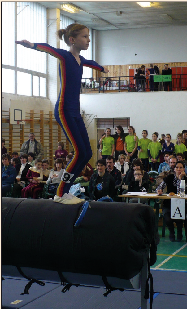
A SZÁRNYALÓ LOVAS SPORT EGYESÜLETET szülői kezdeményezés hívta életre... (21. oldal)