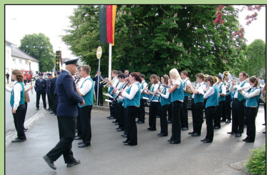
A SÓSKÚTI IFJÚSÁGI ZENEKAR májusban, a bajorországi Mengkofen nagyközség vendége volt. (13. oldal)