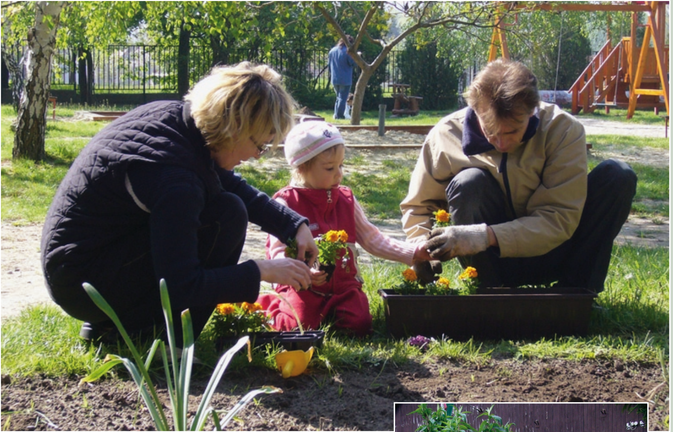
PARKOSÍTÁS, TAKARÍTÁS ÓVODÁBAN, ISKOLÁBAN (9. ÉS 10. OLDAL)