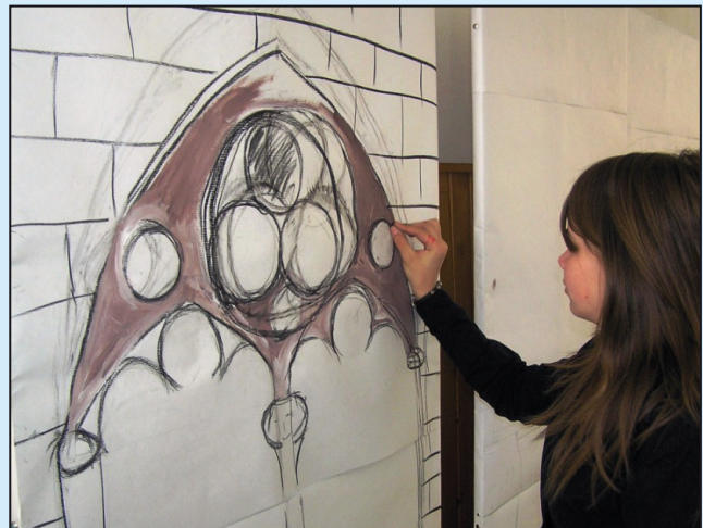
Reneszánsz tavasz az iskolában (10. oldal)