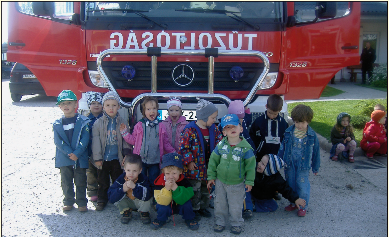
Az óvodások az érdi tűzoltóságon jártak látogatóban (25. oldal)