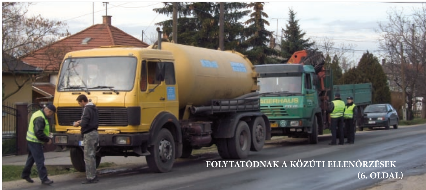
FOLYTATÓDNAK A KÖZÚTI ELLENŐRZÉSEK (6. OLDAL)