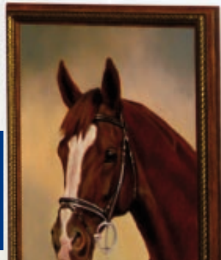
AMATŐR KÉPZŐMŰVÉSZETI KIÁLLÍTÁS (9. OLDAL)