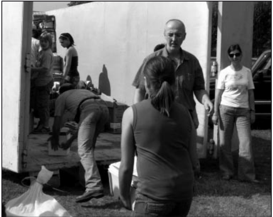
Tizennyolc tonna papír gyűlt össze