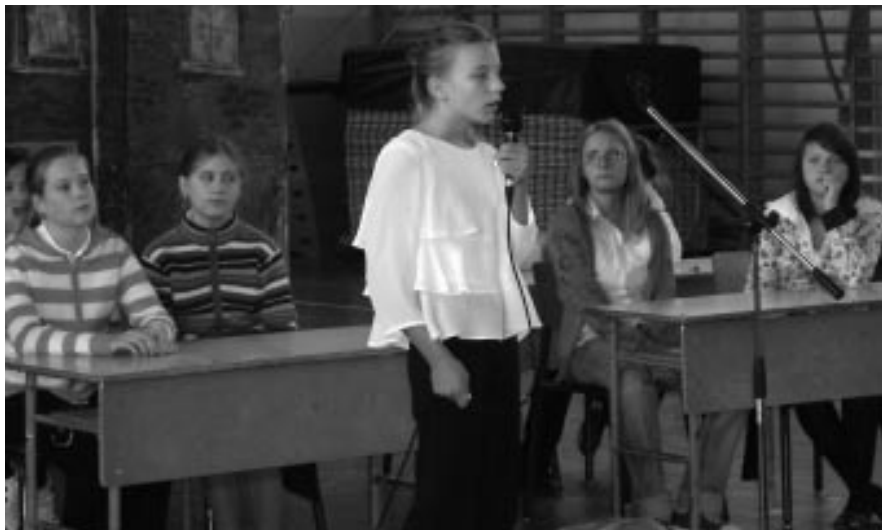
Emlékezés 1956. október 23-ára