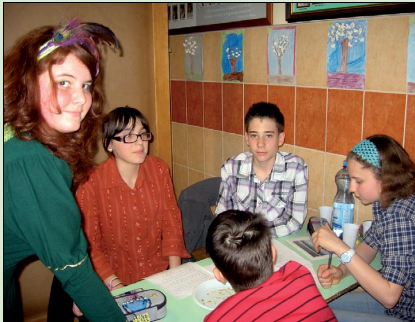
Az iskolában idén is megrendezték az Andreetti-napokat