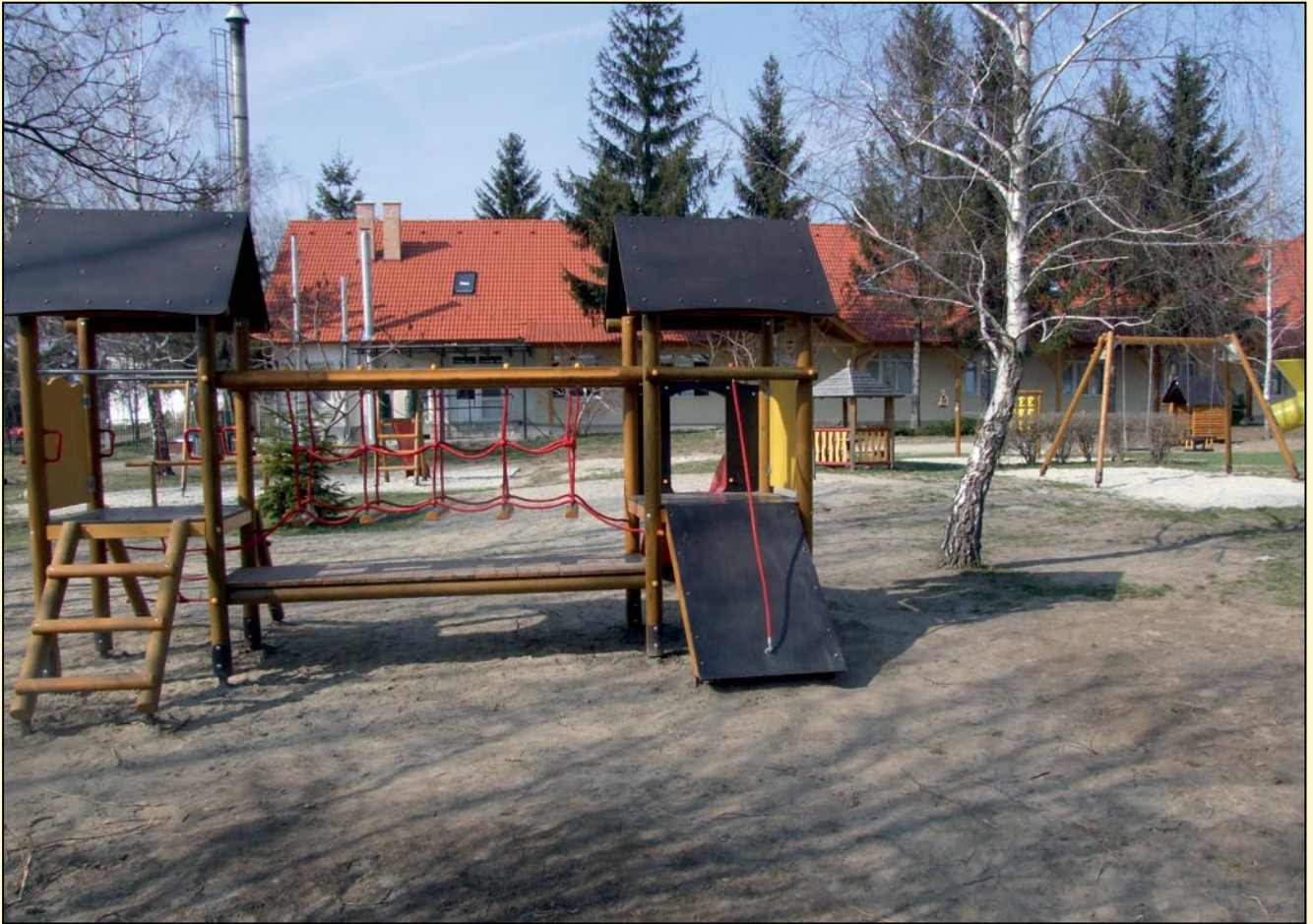
Elkészült az óvoda játszódvára is – 12. oldal