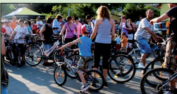
Három falu két keréken