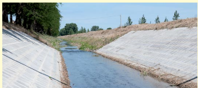
Befejeződött a Benta rehabilitációja 6. oldal