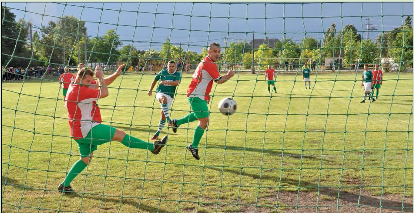
Sóskút öregfiúk–Fradi öregfiúk: 5–13