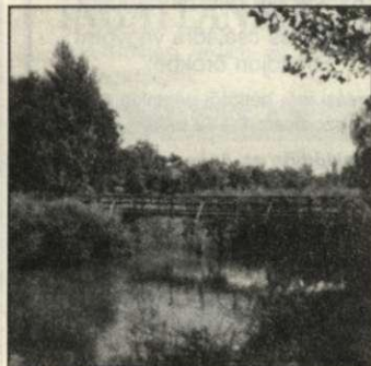
A fahíd 1954-ben