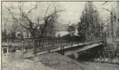
A Zsíros utcai híd 2000-ben