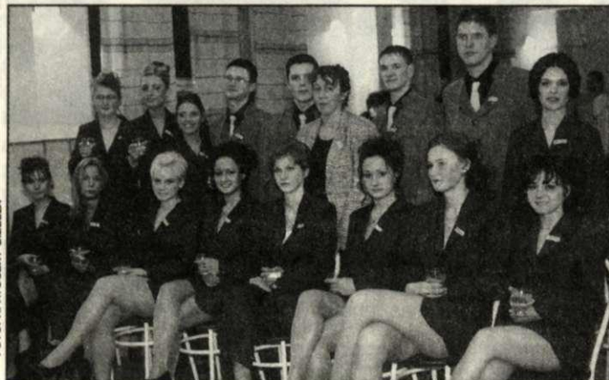
Stužková slávnosť v slovenskom gymnáziu