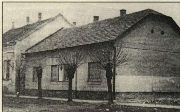
A Lang-ház a 60 éve avatott emléktáblával. Az épület régen nem áll – s az emléktábla, ki tudja, hová lett