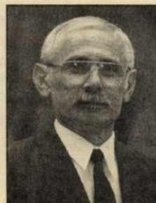
Dr. Vécsei László

Amit elmondtam, abból úgy tűnhet, hogy egy csalódott és elkeseredett ember vagyok, pedig ez nem így van, mert Gerlán szerencsére a dolgok másképpen működnek. A kastély kérdése sajnos még mindig nem oldódott meg, de sok területen látványos a fejlődés nálunk. Bámulatatosan szépek az intézményeink, olyan vezetőkkel és olyan dolgozókkal, akikkel öröm az együttműködés. Az iskolánk nem nagy, a diákjaink mégis nagyon szép eredményeket érnek el a városi és egyéb versenyeken a pedagógusoknak és a szülői háttérnek köszönhetően. 1990-ben az utak 18–20 százaléka volt szilárd burkolata, ma ez az arány csaknem 80 százalék. 15 kilométernyi járdát építettünk át oly módon, hogy mindenben komolyan részt vállalt a lakosság. Talán jobban meg is becsüli mindenki, hiszen a saját keze munkája is benne van. Tornatermet és gyógyszerértartó építettünk, orvosi rendelőt alakítottunk ki, ahol egy kitűnő orvos rendel. Sok olyan rendezvényünk van, amelyeken szívesen vesznek részt a falu lakói. Amit tudtam, megpróbáltam kiharcolni Gerlának a közgyűlésben, de ez a sok változás nem csak az én érdemem. Mindig mindent a lakosokkal közösen építettünk, alakítottunk. Gerlán jó vezetőnek lenni.