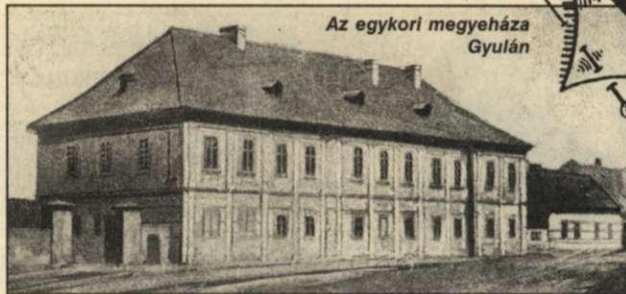
Az egykori megyeháza Gyulán