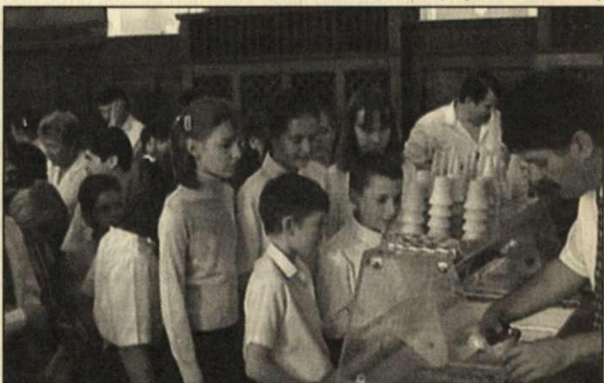
A polgármester fagyit oszt a győzteseknek