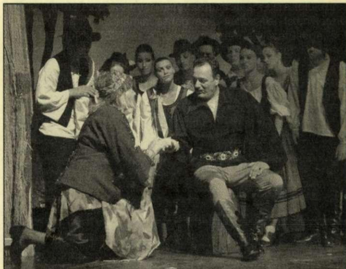
Mit mond a jóslat?