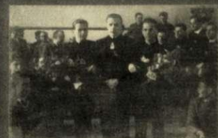
A BÉKÉSCSABAI EVANGÉLIKUS GIMNÁZIUM ÖREGDIÁKJAINAK VISSZAEMLEKEZÉSEI