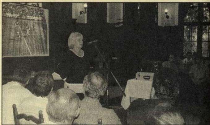
A város vezetői a díszteremben köszöntötték a bajnoksapatot

A feljutással értelemszerűen jelentősen megnövekednek majd a kiadások is, hiszen többek között a csapatot is meg kell erősíteni, s ez bizony pénzbe kerül. Az FC sosem dúskált az anyagiakban, így talán nem véletlen, hogy pletykaszinten megjelent