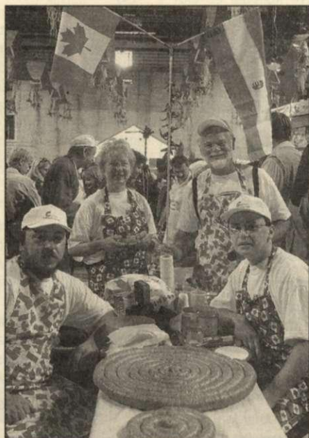
A kanadai-magyar csapat elégedett az eredménnyel