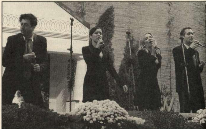
Színpadon a Cotton Club Singers