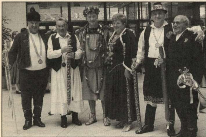
Kolbászlovag a kolbászbírók társaságában

a sportcsarnok melletti sátorban idén borvigadalom és vásár egészítette ki a Bora-Patrick Ital-nagykereskedelmi Kft. szervezésében. A borvigadalom megnyitóján a kiskunhalasi, monori, csongrádi és ceglédi borrendek képviselői mutatkoztak be természetesen az alkalomhoz illő borlovagi ruhájukban. Elmondták, hogy Európában a hatvanas évek elején kezdtek kialakulni a borrendek.