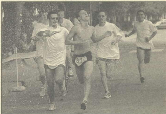
Csabaiak beérkezése (az öröm)