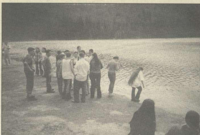
A Szent Anna-tónál a gyerekek