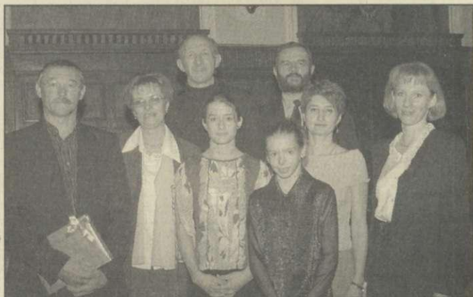
Tornászok a jutalmazáson