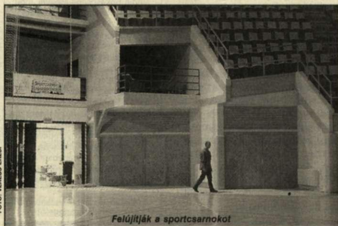
Felújítják a sportcsarnokot