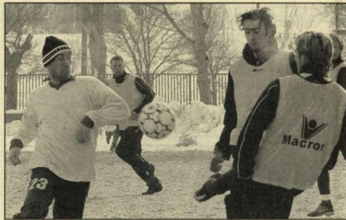
Nemrég játszott az Előre a romániai Iasi Politechnika csapatával

séért. Döntése alapján a csapat a Kórház utcában marad, tekintettel a jelentős utánpótlásbázisra.