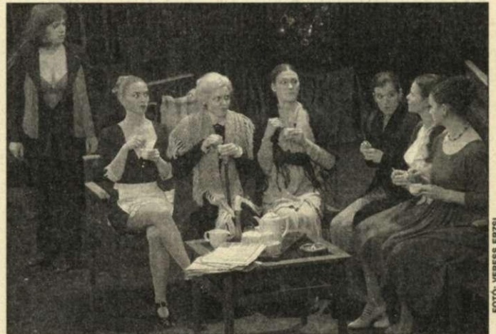
Az Izzalmak tetőfokán

A történet, amit a szerző kiváló szellemességgel írt színpadra, miként más bűnügyi komédiák is: csak látszólag bonyolult, mert igencsak átlátszó, egyszerű. Késsel a hátában holtan találják a ház urát, a család és két alkalmazottjuk, összesen nyolc nő azonnal egymást vádolja a szörnyű tettel. Hátborzongató jelek