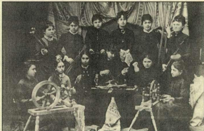
A csabai szövőiskola növendékei, 1884-ben

iparkiállításon ismét megjelent Erzsébet királyné, és dicsérte a csabaiakat azért, hogy a magánjellegű házi iparból kereseti forrást teremtettek a népnek. A kiállítást megtekintette Rudolf trónörökös a nejevel és az uralkodóház összes tagja. Több megrendelést kaptak Sándor bolgár fejedelemtől, külföldi követsegektől, neves színésznőktől. Az 1886–87. évi bécsi karácsonyi vásáron szintén népszerűek voltak a csabai szövészet termékei. A kiállítást felkereső hatalmasságok és külföldi látogatók elgyönyörködtek a csabai termékekben. 1889-ben a győri kiállításon Haan Emma és Löwy Janka mutatta be a gyakorlatban a szövés fortélyait a vendégeknek. Baross Gábor miniszter itt ígérte meg, hogy állandó bazárt állítat fel a hazai és külföldi fürdőkben a csabai népipar termékeinek terjesztésére. Baross miniszter azonban hirtelen meghalt, és vele eltemették a csabai népi szövőipart is.