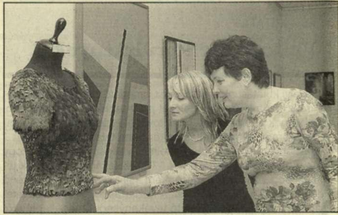
Vendégek a kiállításon