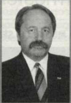
Szenté Béla 1. sz. választókerület