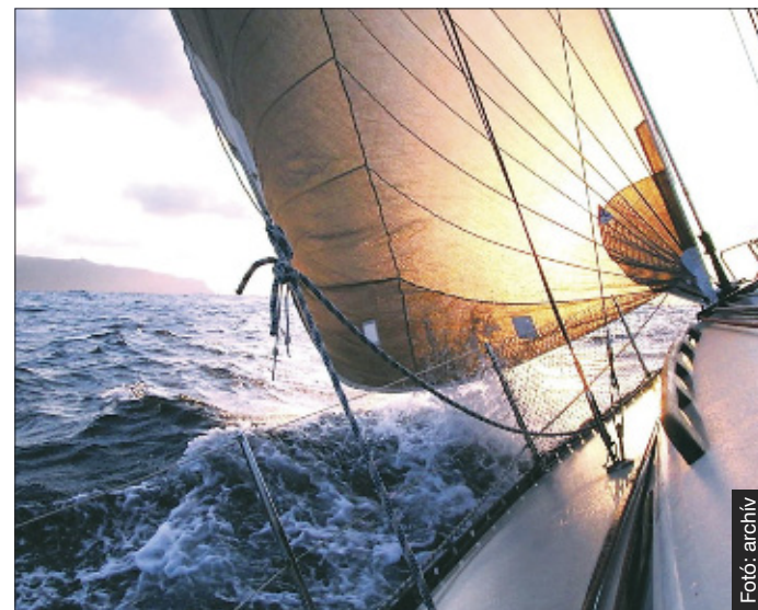
Nemsokára a magyar találmány válthatja fel a hagyományos vitorlákat

nyos vitorlákhöz képest mintegy 50 százalékos teljesítménynövekedés érhető el a segítségével. Remélem, hogy a hatékonyságát a következő versenyen be is tudjuk majd mutatni. Ha sikeres lesz, akkor talán több hajón is viszontláthatjuk majd. G. B.