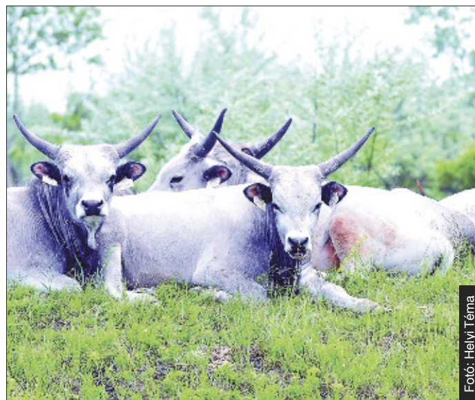
A szürkemarha nemcsak ízvilágában más