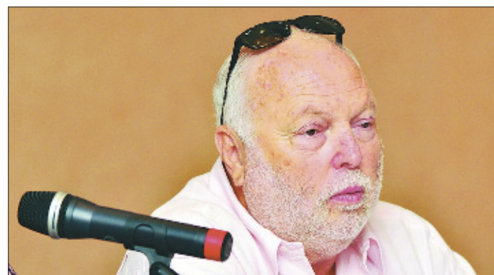
Vajna a világpiacon vinné a magyar filmet

A producer nem szeretett volna konkrét személyeket kiemelni, akiket exportálhatunk majd.