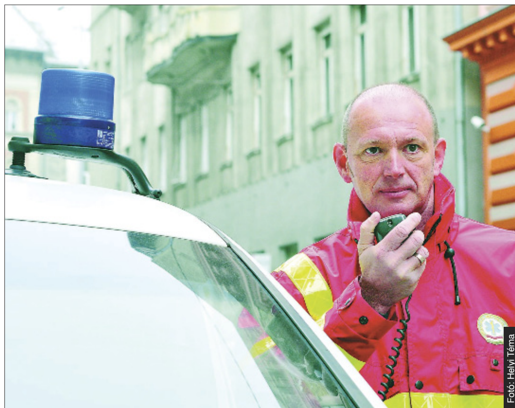
A szóvivő a hajbeültetést választotta