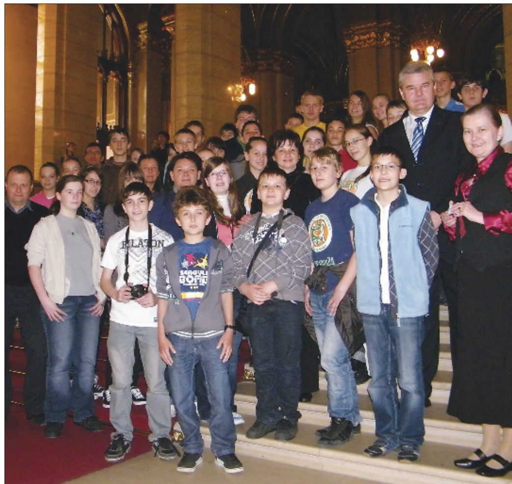
A 2-es iskola diákjait Vantara Gyula polgármester kalauzolta a Parlamentben