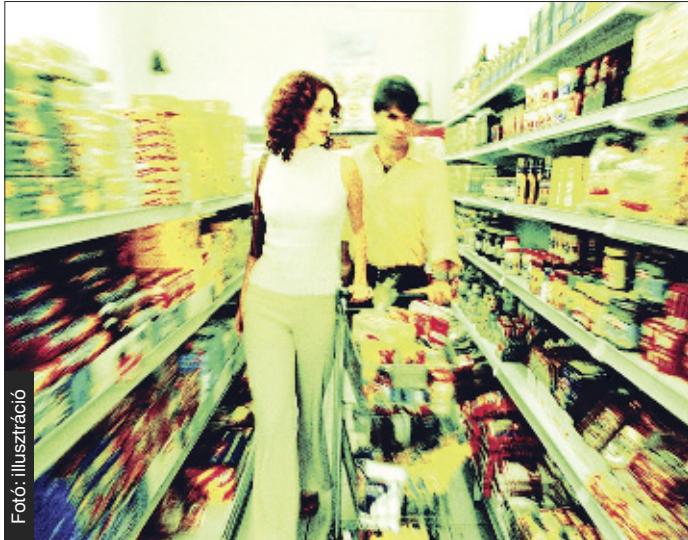
Az egyes gyártók Európában több kategóriába sorolják a fogyasztókat

Eddig csak a szóbeszéd szólt arról, hogy a Nyugat-Európából hozott üdítő, csoki, illetve egyéb élelmiszer finomabb, mint amit ugyanaból a fajtából Magyarországon lehet kapni. Most egy, az Európai Unió által támogatott vizsgálat bebizonyította: az új tagállamok piacaira a multinacionális gyártók, a nyugatitól eltérő, más összetételű termékeket szállítanak azonos vagy magasabb fogyasztói áron.