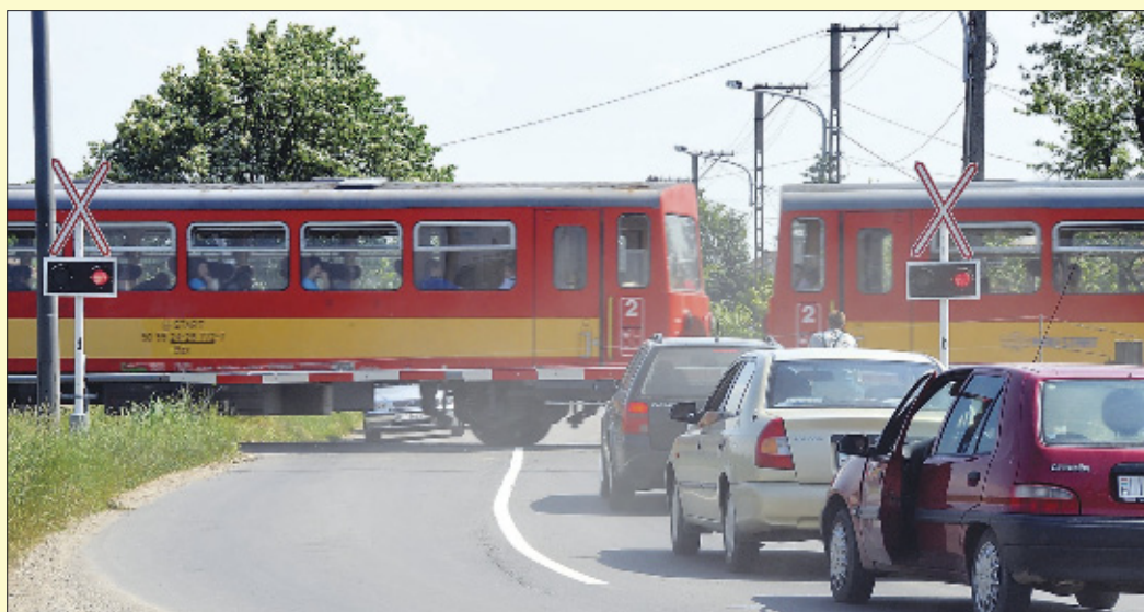
A Franklin utcai aluljárón keresztül biztonságosan mehetünk majd a vonatok alá

– A fejlesztés lényege a vasúti pálya fejlesztése, így a békéscsabai vasútállomáson keresztül hamarosan 160 km-es sebességgel közlekedhetnek a vasúti szerelvények. Ennek köszönhetően alig másfél óra alatt lehet majd Budapestre jutni a beruházás befejezését követően – kezdte az állami fejlesztéssel kapcsolatos beszámolóját Vantara Gyula, aki a vasútfejlesztés helyi vonatkozásait mutatta be részletesebben. A polgármester hangsúlyozta, hogy a pálya-beruházások mellett sok más, a város számára fontos fejlesztés valósulhat meg az állami és uniós forrásból finanszírozott vasútrehabilitá-