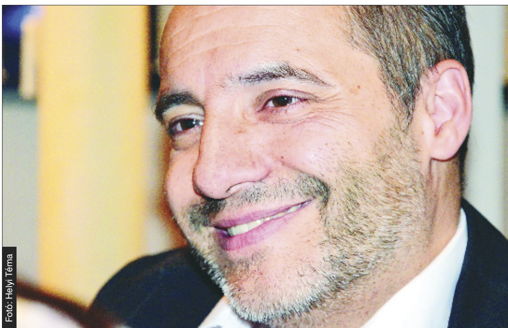
„Lali és a film visszahatott rám”