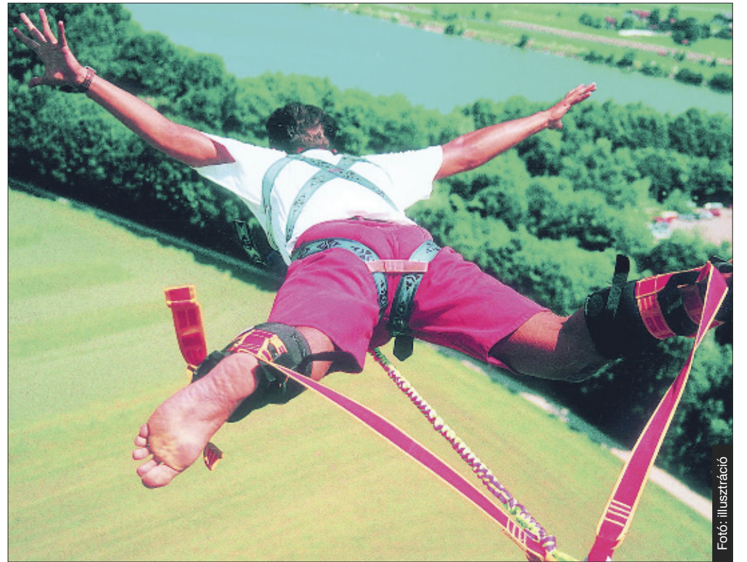
A stresszt régen természetes közegben éltük meg, most azonban fizetnünk kell érte