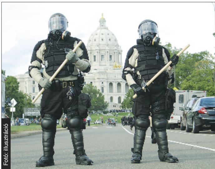
Az Egyesült Államokban minden évben vannak komoly faji zavargások

Az USA-ban az elmúlt 4 évben 5 komolyabb faji alapú zavargás került be a hírekbe: 2008-ban egymás után 3 főiskola (a Los Angeles-i Locke High School, a New York-i Hempstead High School és az Észak-Karolinában található Carrboro High School) diákjai lázadtak fel és ugrottak etnikai alapon egymásnak, tucatnyi diák súlyosan, sokan könnyebben megsérültek. A Hempstead és a Carrboro főiskola esetében latin és fekete diákok között robbant ki a többnapos konfliktus, amely általában a megfélemlítéstől és megaláztatástól a tömegverekedésekig terjedt. 2009-ben a kaliforniai Oaklandben egy békésen tüntető fekete aktivistát lelőtt egy rendőr, 2010-ben pedig ismét fellángolt a feketék és a latinok közötti feszültség a Hempstead Főiskolán.