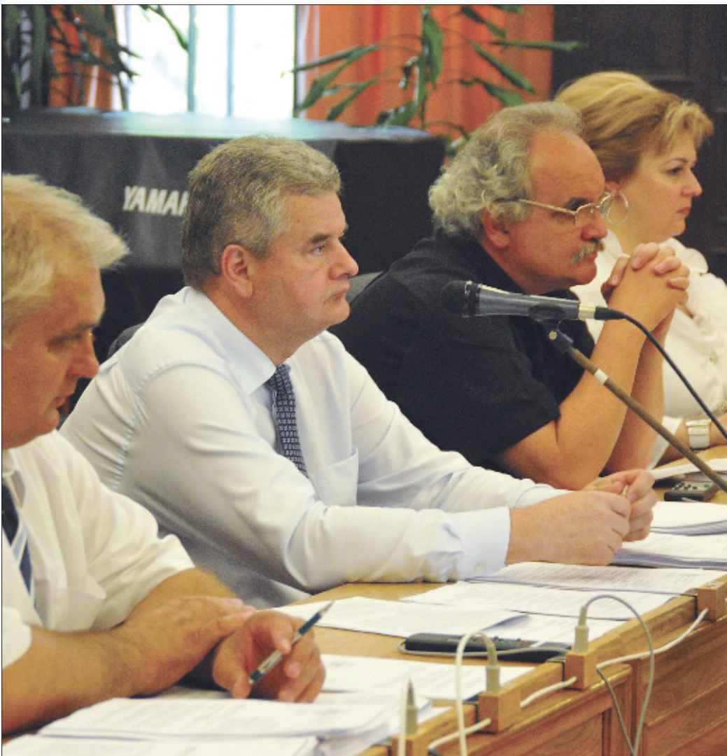
A város vezetése nem mond le a már elnyert uniós fejlesztési forrásokról