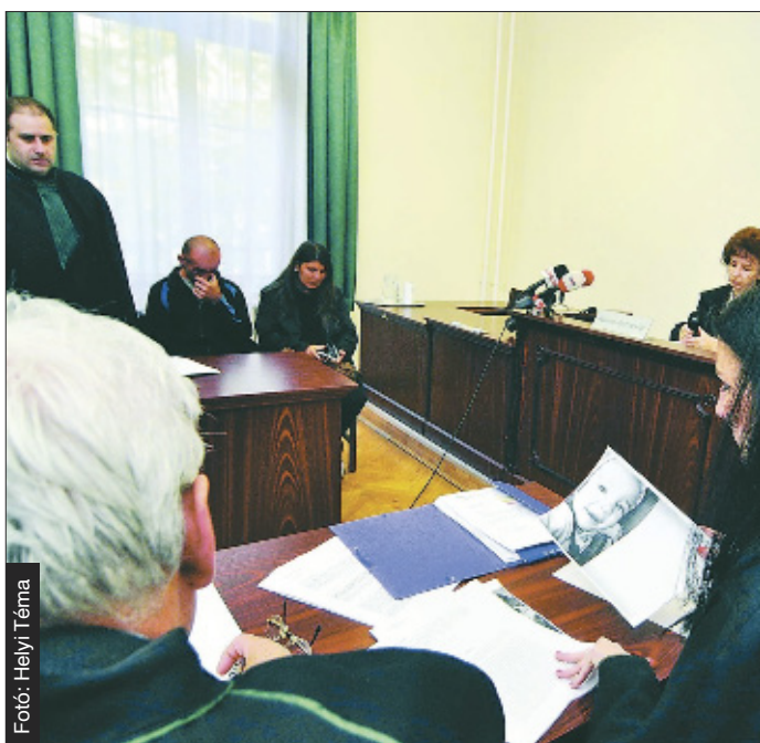
A felperesek – a házaspár és három gyermeke – összesen 48 és fél millió forintot követelnek a MAL Zrt.-től