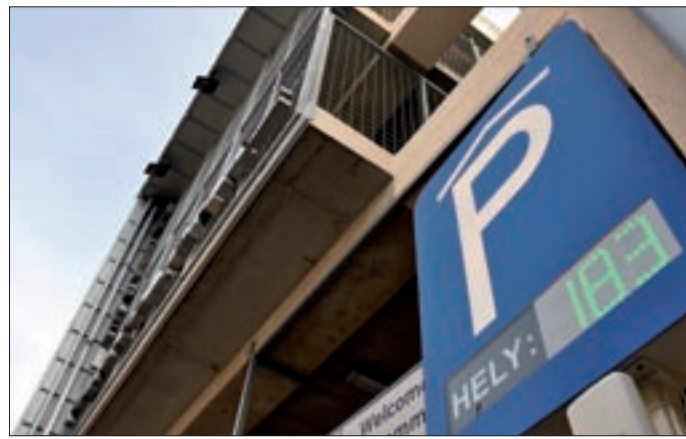
A Belvárosi Parkolóház olcsóbb, mint a kiemelt övezet

A tanácsnok beszélt arról, hogy a parkolásnál az inflációt meg nem haladó díjmeléssel számolnak. Jövő évtől az abszolút belváros kiemelt, a többi parkolási övezet normál díjas, a parkolóház pedig olcsóbb lesz, mint a kiemelt övezet. Hozzátette, hogy a kiszámítható, fenntartható, kulturált parkolás érdekében, és hogy ne legyenek zsúfoltak a belvárost környező utcák, a parko-