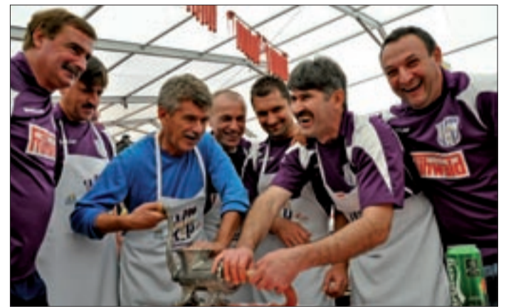
A bajnokok csapata a szövetségi kapitánnyal gyúrt