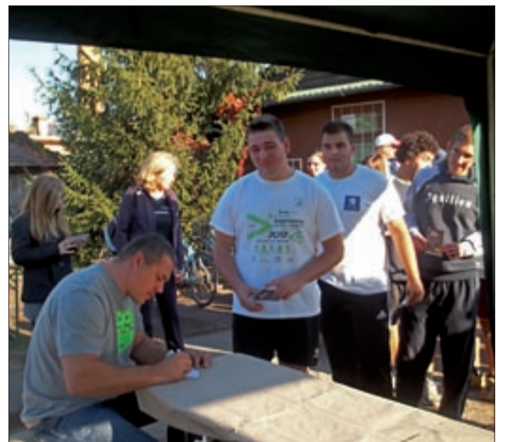
Pars Krisztián nem győzött autogramot osztogatni

A Buda-Cash Békéscsabai Atlétikai Club a kolbászfesztivál idején tartotta szokásos évi focitornáját a sportolók, szimpatizánsok és szülők részvételével. A Tünde utcai pályára ellátogatott Pars Krisztián kalapácsvető olimpiai bajnok, és hazajött Baji Balázs, a klub gátfutó olimpikonja is. Pars Krisztián szombathelyi atléta a londoni nyári olimpián 80,59 méteres dobásával utasította maga mögé versenytársait. A kalapácsvető – miután a kolbászfesztiválon bebizonyította, hogy gyűrásban is jó – elvégezte a kezdőrúgást a focitornán és állta az autogramkérők rohamát.