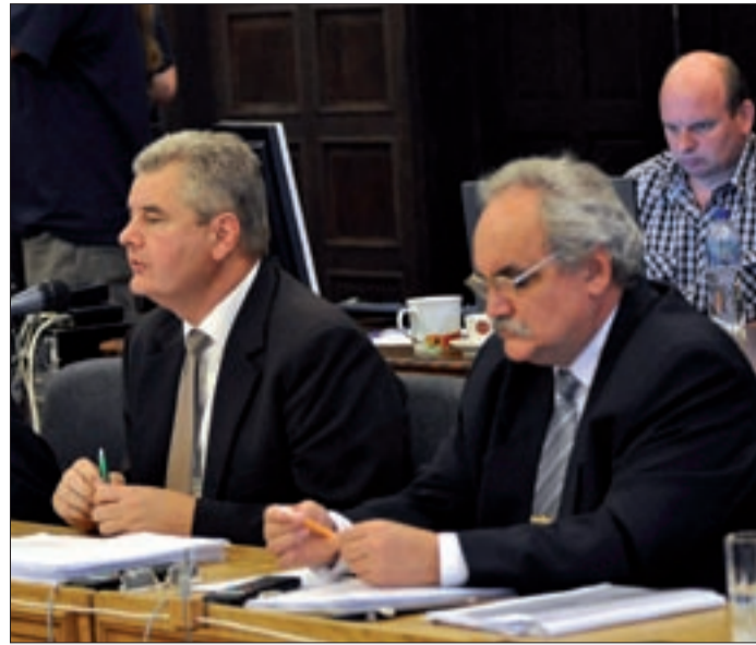
Az a cél, hogy a belváros útjain minél rövidebb ideig tartózkodjanak az autók

A belváros-rehabilitáció részeként lezárták a Szent István teret, ezért rendeletben kellett szabályozni a behajtási övezet forgalmi rendjét. Eszerint az elzárt területre behajtani a Szabadság tér József Attila utca felőli részéről és a volt Centrum Áruház felől lehetne, míg a kihajtás a Rossmann Áruház és a katolikus templom felé volna lehetséges. A behajtást földbe süllyeszthető oszlopok (pollerek) szabályoznák, amelyet a Békéscsabai Vagyonkezelő Zrt. üzemeltet. Az állandó diszpécser szolgálatot ugyan csak a vagyonkezelő parkolóházi ügyeletét ellátó alkalmazottja biztosítja. A