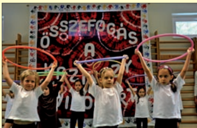
Az óvodások műsorral kedveskedtek a vendégeknek