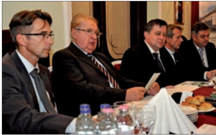
A kamara tapasztalata segítség az iskola számára

Azon munkálkodunk, hogy a külkapcsolatok területén is minél nagyobb segítséget nyújtsunk a vállalkozá-