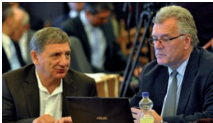
Az önkormányzat a kulturáltabb szórakozás mellett van