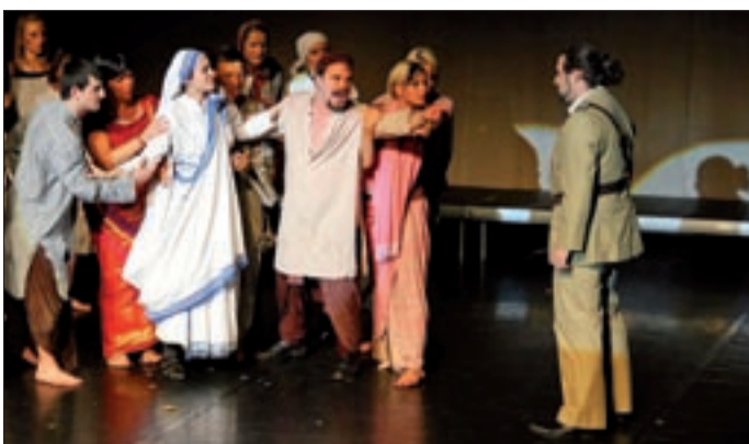
A programoknak a Jókai színház adott otthont