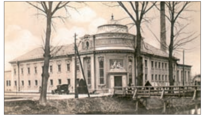
Az Árpád gőz- és kádfürdő épülete 1930 táján