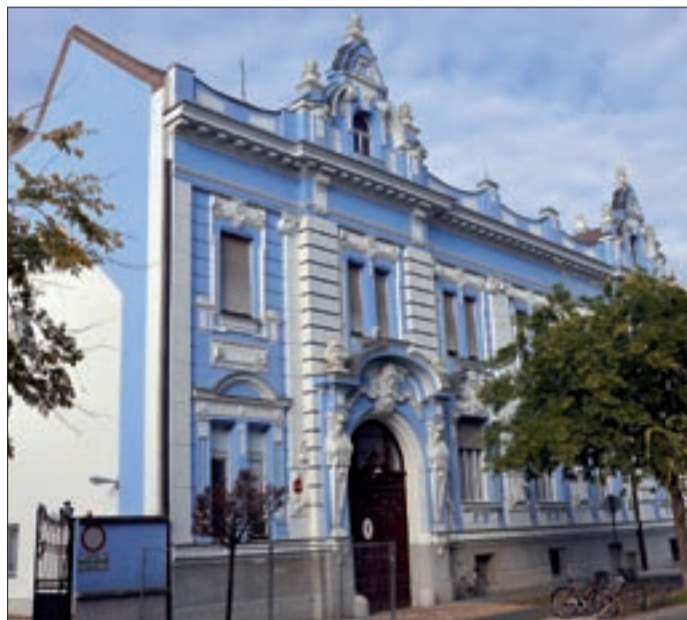
Csabán a Dózsa György út felől van a bejárat

A nemzetközi tőkepiaci válság hatására nőtt a belföldi finanszírozás fontossága, ezért a Kincstár számára kiemelt feladat a közvetlen lakossági értékesítés növelése. Az állam stabil pénzügyi partner mindenki számára, ugyanis az állampapírok je-