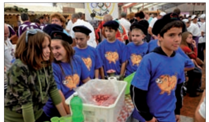
A hagyományt és a családi recepteket ők viszik tovább