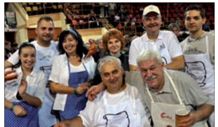
M. E. Csabaiban természetesen a csabaiak a legjobbak