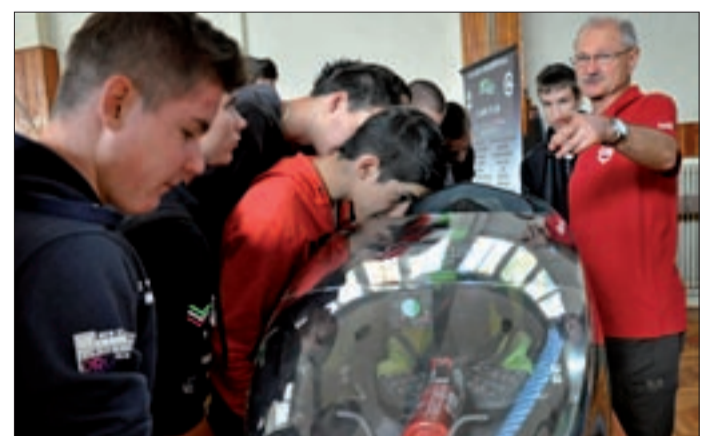
A legnépszerűbb program a motorkiállítás volt

Október 24. és 27. közt rendezték meg a Kemény Gábor szakközépiskolában. A több mint másfél évtizedes múltú visszatekintő, négynapos rendezvény alatt a diákokat számos érdekes, izgalmas program várta.