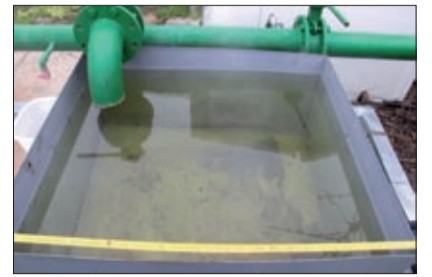
A friss, tiszta gyógyvíz

szemben az új technológia alkalmazásával, most szivattyú hozza fel a felszínre a gyógyvizet, ami egy teljesen zárt rendszeren keresztül szinte azonnal a medencékbe jut. Ez minőségi javulást von maga után, hiszen nincs pangás, nincs oxidáció, s most egyharmadával több vizet veze-