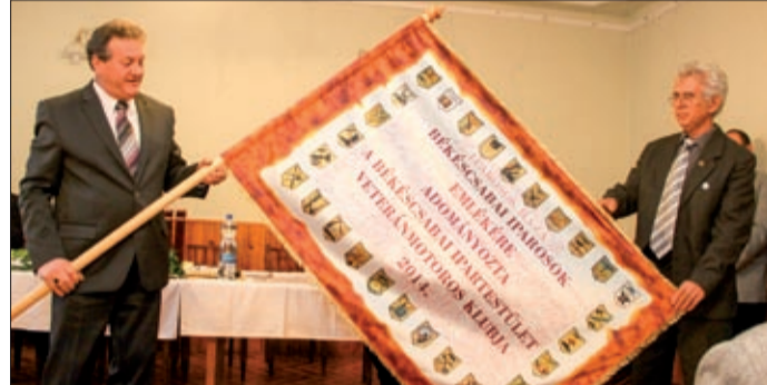
A békéscsabai iparosok emléket idézi a zászló