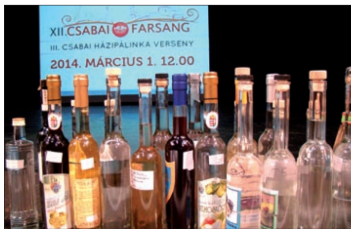
Összesen 106 üveg pálinka sorakozott a színpadon