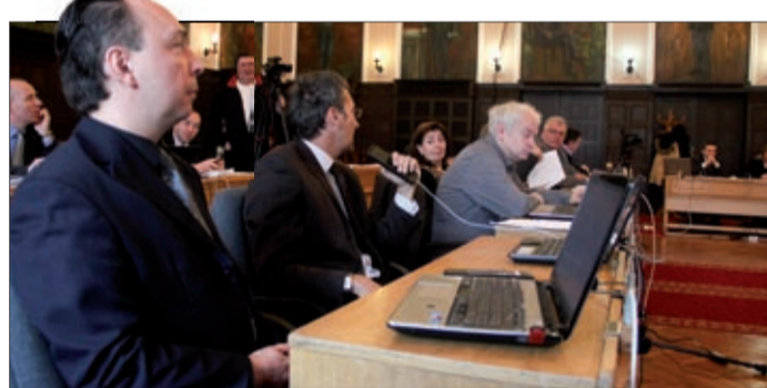
A nemzetiségeket jelentős összeggel támogatja a város

A nemzetiségi önkormányzatok a részükre juttatott 221 833 forint központi költségvetési támogatásból, a feladat-alapú támogatásból és a rendelkezésükre bocsátott egyéb forrásokból (települési önkormányzat támogatása, pályázatok, saját bevétel) látták el feladatukat. Tavaly a lengyelek 1 429 000, a romák 2 517 000,