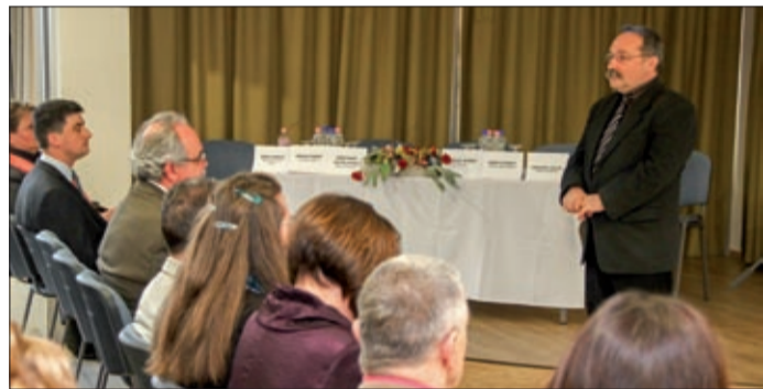
Az emlékévé jó apropó a Munkácsy-kultusz népszerűsítésére