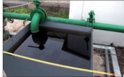
A víz, miután levegővel érintkezett