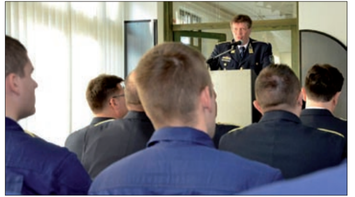
A megyében 94-en kezdik meg hivatalos szolgálatukat

A Békés Megyei Rendőr-főkapitányság vezetője köszöntötte azokat a próbaidős rendőröket, akik szakképzésük gyakorlati ideje alatt Békésben teljesítenek szolgálatot.