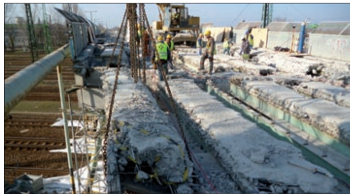
Az Oroszházi úti felüljáró bontásának pillanatai

A vasúti jegypénztárak március 19-én költöznek át az épületből a buszpályaudvar aluljárójában helyet kapó konténerbe.