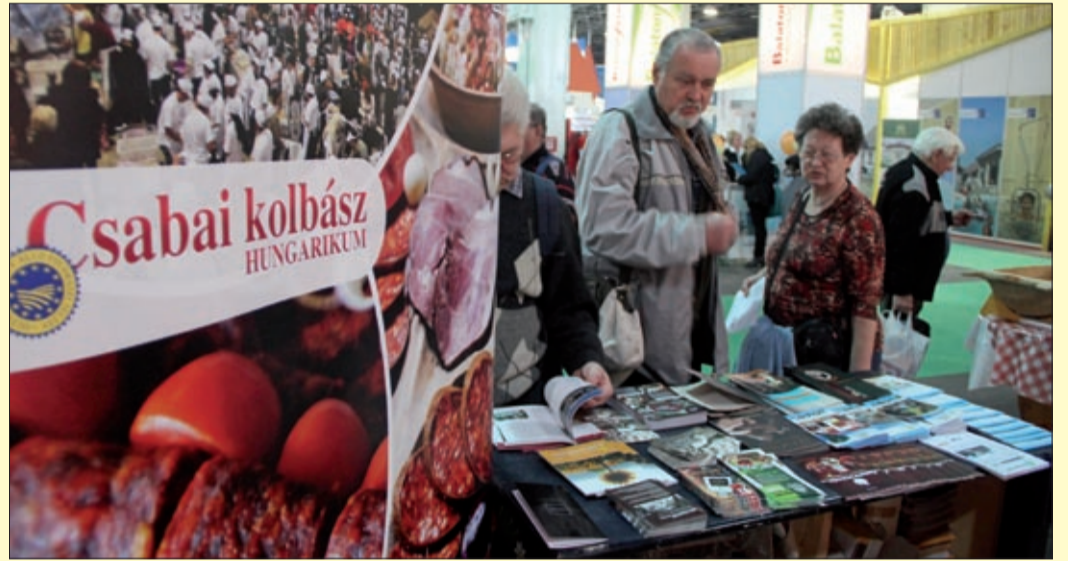
Békéscsaba saját standdal képviseltette magát a kiállításon

A fentiek is azt bizonyítják, hogy a korábbi évek turisztikai