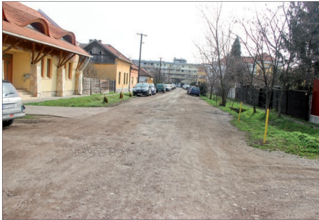
A belváros-rehabilitáció második üteme a Knézich utcát is érinti

A közgyűlés napirendjén szerepelt a belváros-rehabilitáció második üteme projektötletének benyújtása. Az új pályázatban elnyerhető támogatás legfeljebb 740 millió forint, a támogatási intenzitás pedig 100 százalékos, így a megvalósításhoz nem szükséges önkormányzati önerő.